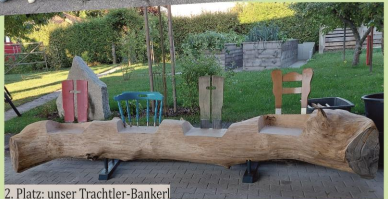
2. Platz: unser Trachtler-Bankerl

1. Platz Bankerl Jugendfeuerwehren Siegerfoto 1.-3. Platz